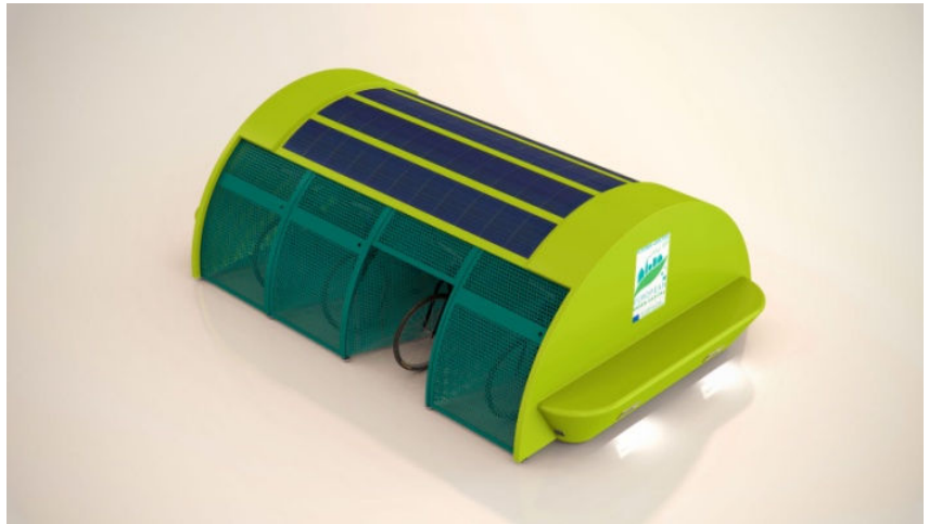
Photovoltaic Solar Electricity Potential in European Countries