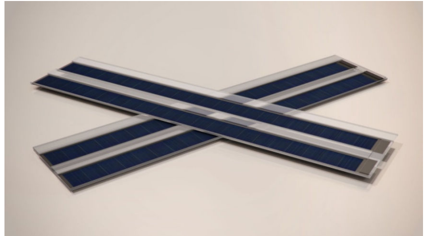
Photovoltaic Solar Electricity Potential in European Countries