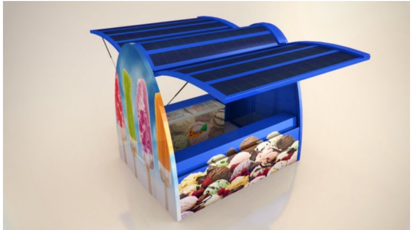
Photovoltaic Solar Electricity Potential in European Countries