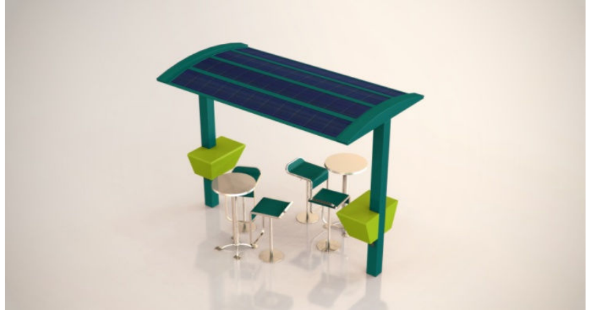
Photovoltaic Solar Electricity Potential in European Countries