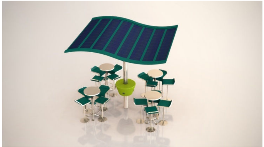
Photovoltaic Solar Electricity Potential in European Countries